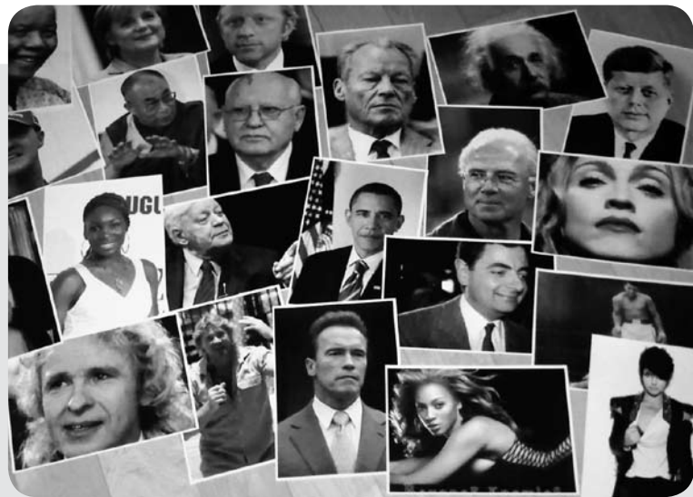
Einige Helden aus der Übung

Eine wunderbare Übung, um mit der Gruppe über Werte und Inspirationen sprechen zu können, ist die Übung „Helden“. Sie geht folgendermaßen: Der Trainer hat 35 bis 40 Porträts von berühmten Persönlichkeiten auf DIN-A4-Blättern in Farbe ausgedruckt. Es sind Porträts von Politikern, Wissenschaftlern, Sportlern, Künstlern oder TV-Persönlichkeiten,